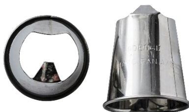
*ODENSE Snabeltyller Varenr. 111061 – 1 stk.