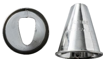
*ODENSE Trekanttylle 1 Varenr. 111059 – 1 stk.