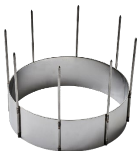
ODENSE Ægedykker Dyp 8 æg ad gangen Varenr. 111048 1 x 1 stk.