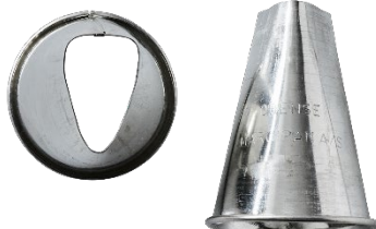
*ODENSE Trekanttylle 2 Varenr. 111070 – 1 stk.