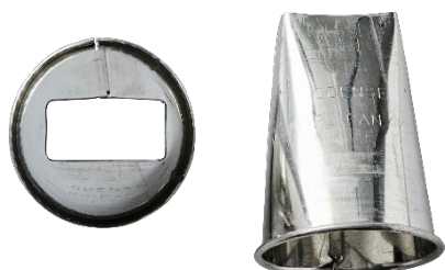
*ODENSE "Celebration" tyller (bund-tyller) Varenr. 111068 - 1 stk.