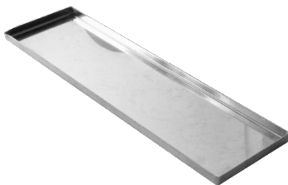
ODENSE Konfektbakke 460x210x13 mm Varenr. 111052 1 x 1 stk.