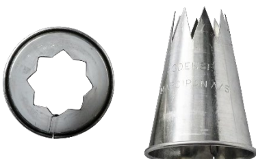
*ODENSE Stjernetyller 18 mm Varenr. 111065 – 1 stk.