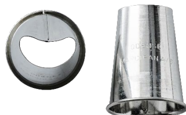
*ODENSE C-tyller Varenr. 111063 – 1 stk.