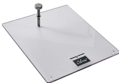
ODENSE Hornopretter Med regulerbar skrue Varenr. 111054 1 x 1 stk.