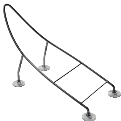
ODENSE Hornstativ Til horn 21, 24 og 28 Varenr. 111050 1 x 1 stk.