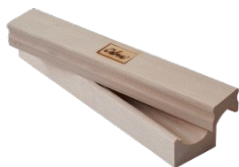
ODENSE Æggerulle Lille 25 cm til 12 g æg Varenr. 111111 1 x 1 stk.