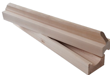
*ODENSE Æggerulle Stor 60 cm til 45 g æg Varenr. 111049 1 x 1 stk.