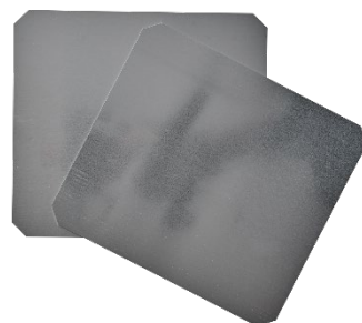
ODENSE Miniplader Til petit fours 210x190 mm Varenr. 111080 1 x 6 stk.