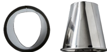
*ODENSE Trekanttylle 3 (Megatyller) Varenr. 111066 – 1 stk.