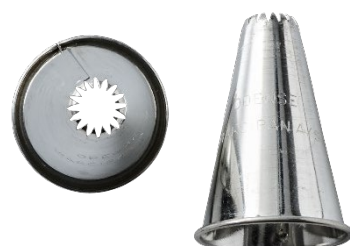
ODENSE Stjernetyller 10 mm Varenr. 111067 – 1 stk.