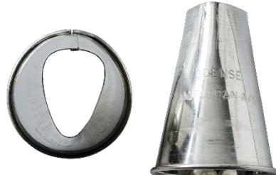
*ODENSE "Mandorla" tyller Speciale tyller 22 mm Varenr. 111069 - 1 stk.