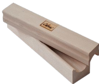
ODENSE Æggerulle Mellem 40 cm til 25 g æg Varenr. 111047 1 x 1 stk.