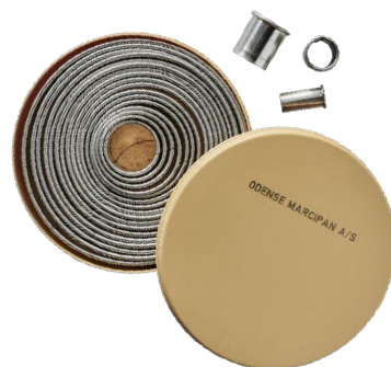
ODENSE Udstickersæt Rundt, 20 udstikkere Varenr. 111071 1 x 1 sæt