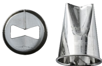
*ODENSE X-tyller Varenr. 111064 – 1 stk.