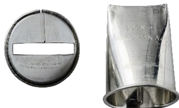
*ODENSE Flad tyller Varenr. 111060 – 1 stk.