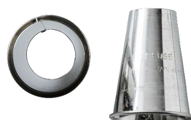
*ODENSE Rund tyller 22 mm Varenr. 111074 - 1 stk.

*Tyller der passer til ODENSE Odenmaster udsprøjtningsmaskine (1 sæt = 8 stk.) *Udgår af sortiment